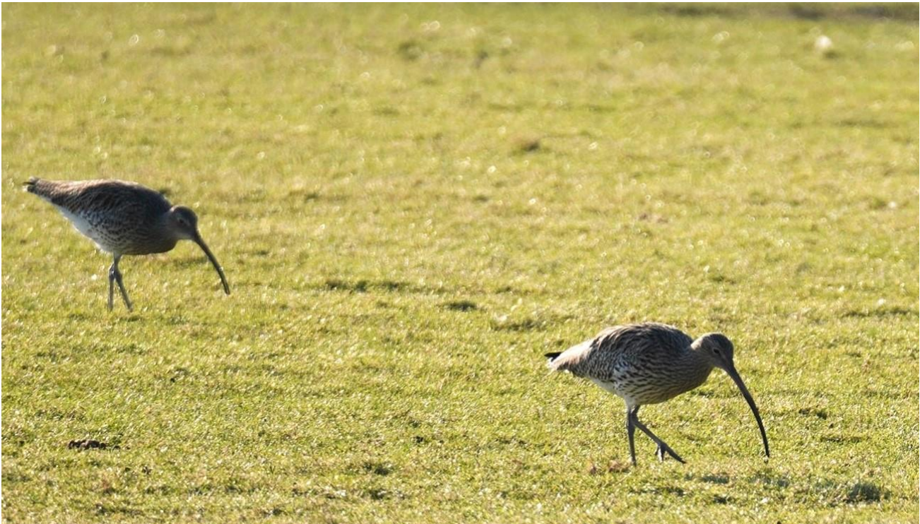
28-1-2025 wulpen op het grasland langs het riviertje De Koedood.

Vandaag liep ik langs het riviertje de Koedood in de Rhoonse polders. Behalve een groepje fazanten en enkele graspiepers zag ik tot mijn vreugde ook een groepje wulpen. Zij zochten naarstig met hun lange kromme snavel naar insecten en wormen in het gras. Een groepje wulpen komt elke winter op dit grasland foerageren. Het is op het eiland IJsselmonde de enige plek waar wulpen verblijven in de wintermaanden.