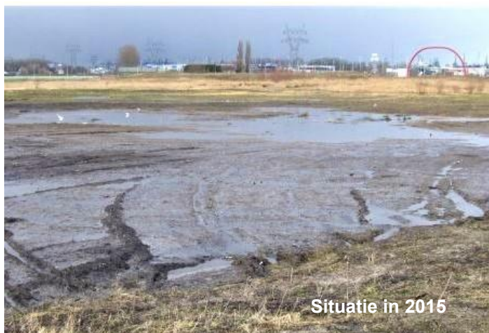
Situatie in 2015

De les die we hieruit moeten leren is dat rommelige ruigte juist van groot belang is voor de natuur. Dat valt dan niet binnen het menselijke schoonheidsideaal van strak en ordentelijk, maar daar zullen we toch eens aan moeten wennen?