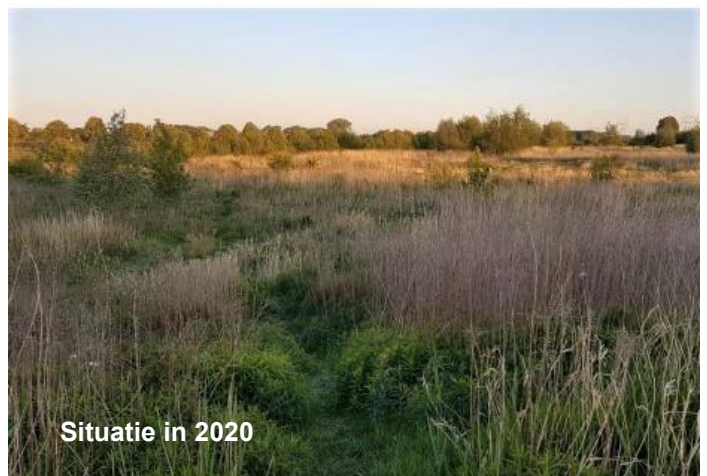
Situatie in 2020